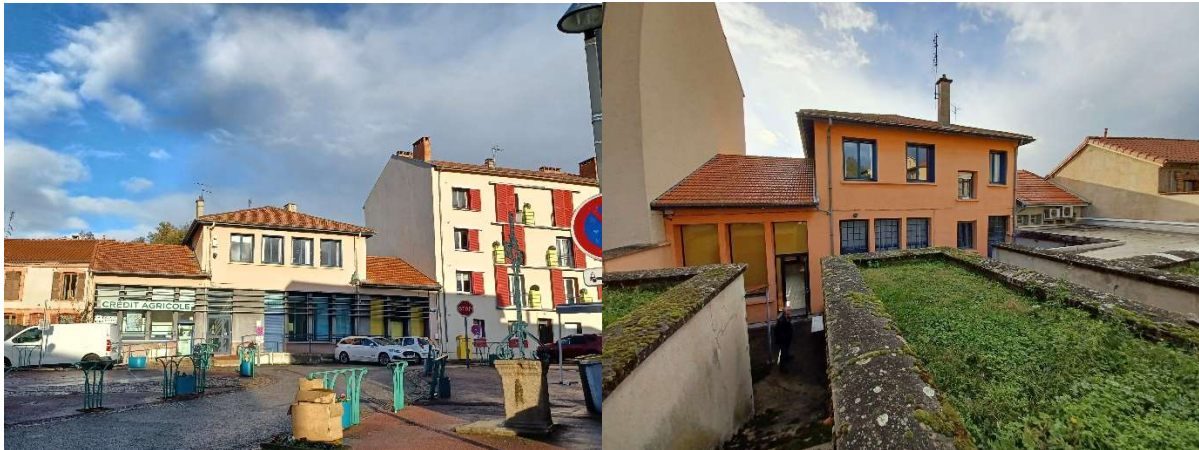
Figure 1 Vues actuelles du bâtiment